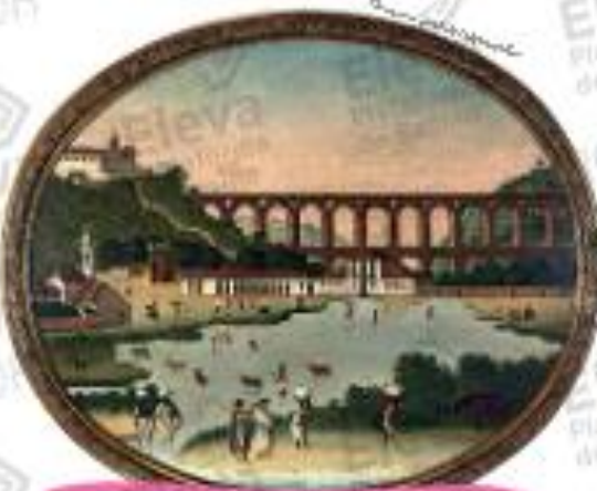
Lagoa do Boqueirão e Aqueduto de Cariocas. Pintura de Leandro Joaquim (atribuída). Rio de Janeiro, 1790. Arquivo do Museu Histórico Nacional

12 Observe a pintura de uma paisagem do Rio de Janeiro em 1790 e compare-a com a fotografia.