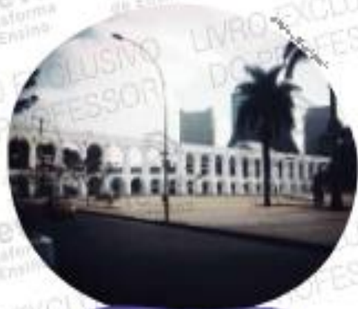
Arcos da Lapa, Rio de Janeiro, 2019

A) Você consegue reconhecer algum elemento da paisagem do Rio de Janeiro da pintura e que ainda existe nos dias de hoje? Qual?