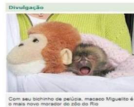
Com seu bichinho de pelúcia, macaco Miguelito é o mais novo morador do zôo do Rio

O Jardim Zoológico do Rio ganhou um novo morador. Seu nome é Miguelito, um macaco de peito amarelo, que nasceu no final do mês passado. O animal, que só é encontrado no sul da Bahia, está em extinção, segundo o zôo.