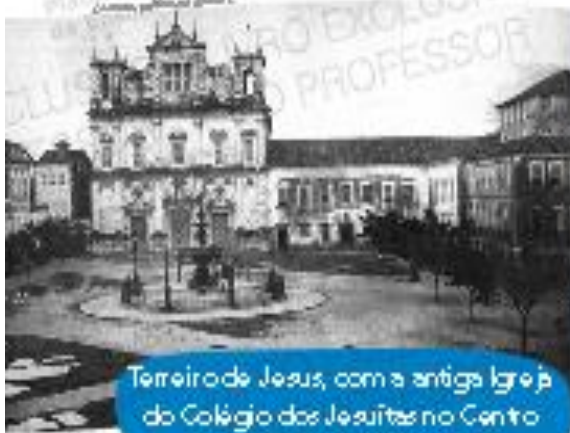
Terreiro de Jesus, com a antiga Igreja do Colégio dos Jesuítas no Centro Histórico de Salvador, 1962

As fotografias são documentos que podem registrar a história da comunidade. Nelas, podemos identificar mudanças e permanências na comunidade.