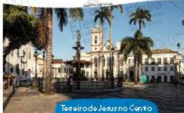
Terreiro de Jesus no Centro Histórico de Salvador, 2012

02. Que mudanças e permanências você pode perceber no Terreiro de Jesus?